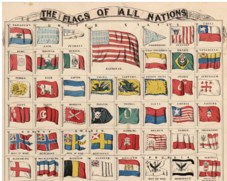
AUSZUG AUS EINEM US MARINEHANDBUCH

Wir finden jeweils den Silant (Dra-chenschlange) oder die Eule auf gold-tem Untergrund. Man beachte vor allem die prominente Plazierung direkt unter der amerikanischen Flagge. Es scheint also tatsächlich ein bedeutendes Land gewesen zu sein.