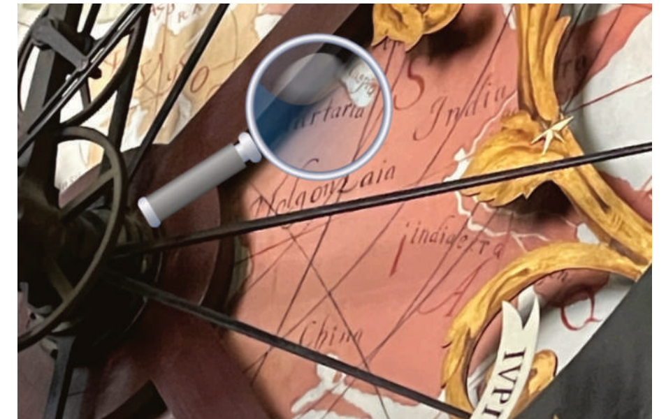
ASTRONOMISCHE UHR IM ST.-PAULUS-DOM MÜNSTER.

ein detaillierter Artikel über „Tartary“, der dann allerdings bereits in der Folgeedition verschwunden ist. Das dürfte ein Hinweis auf den endgültigen Untergang von Tartaria sein. Spätestens mit dem Marsch Napoleons nach Moskau (St. Petersburg war die russische Hauptstadt – warum sollte Napoleon den übrigens deutlich weiteren Weg nach Moskau marschieren?) scheint Tartaria wahrscheinlich letztlich durch eine Kombination von Kriegen und Naturkatastrophen zusammengebrochen zu sein – endgültig irgendwann nach 1812.