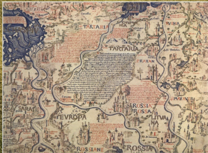
KARTEN AUS DEM 15. JAHRHUNDERT (NETZFUNDE)

Die Tradition und vor allem die Verbindung zu den Ahnen muß abgeschnitten werden. Je länger ich mich mit der Geschichte Tartarias befasse, desto mehr komme ich zu dem Schluß,