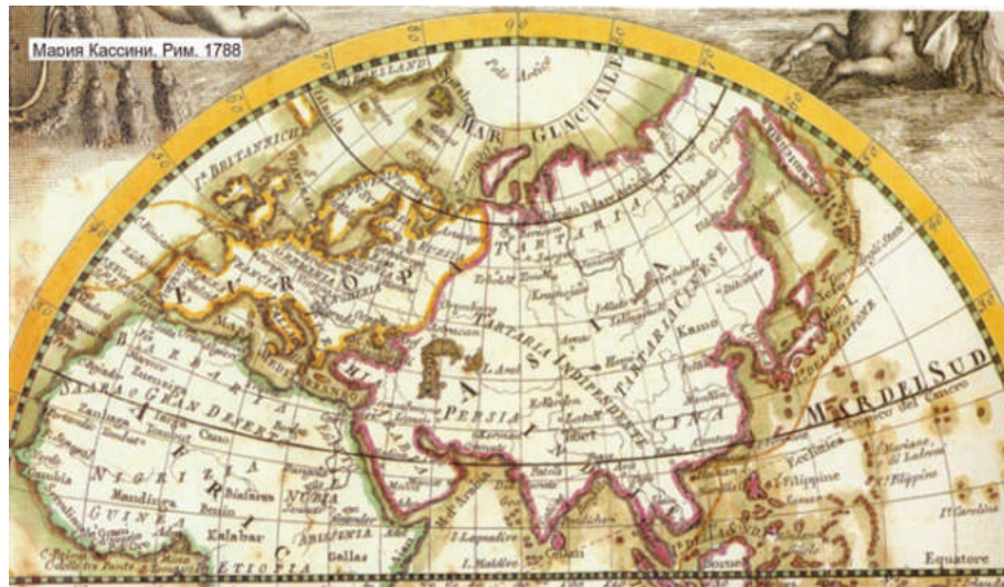
KARTE EURASISCHE LANDMASSE, TEILE AFRIKA UND OZEANIEN, A.D. 1788 (NETZFUND)

Aber geben wir uns nicht nur zu frieden mit dem reinen Kartenstudium. So ein riesiges Reich muß doch auch noch andere Spuren hinterlassen haben, oder?